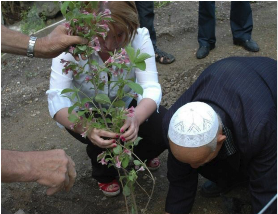
Mbjellja e drunjëve në Banjën e Tetovës - 2013