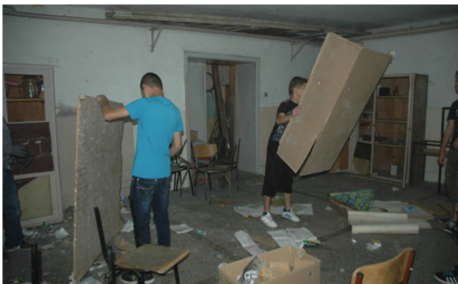
Aksion për pastrimin e Sh.F Liria dhe Kirili dhe Metodi - 2014