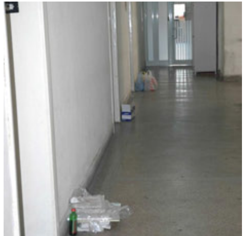
Aksion i pastrimit të hapësirës së komunës së Tetovës -2013