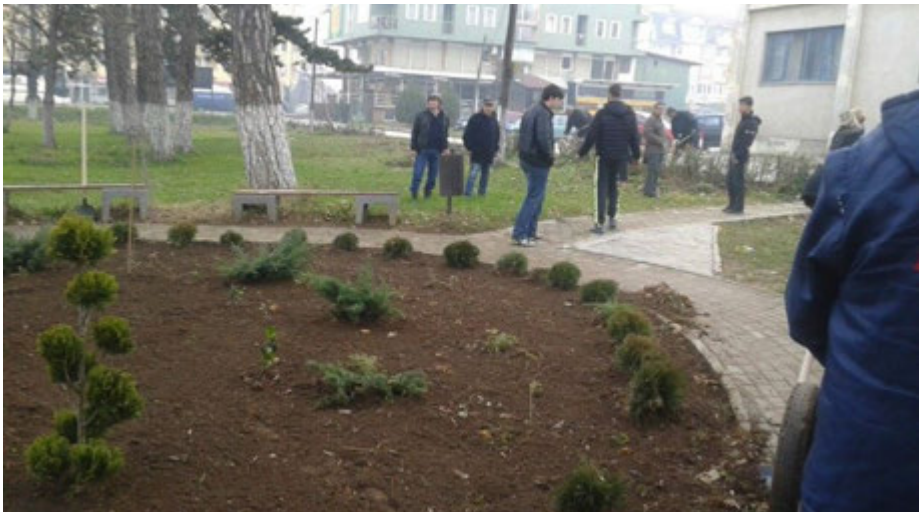
Aksioni ekologjik ‘Të pastrojmë Tetovën’ - 2015