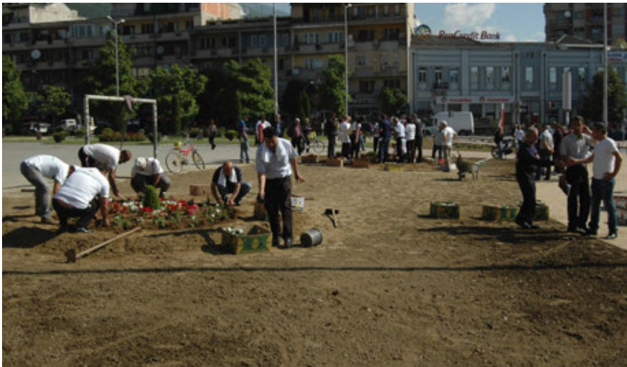
Faza e parë e aksionit: Ta pastrojmë Tetovën - 2014