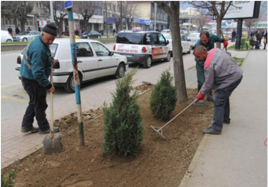
‘21 Marsi’ Dita nderkombëtare e ekologjisë - 21 Mars 2016