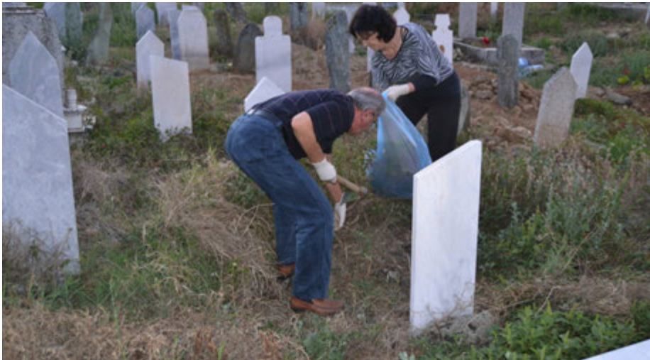
“Ta pastrojmë Tetovën” - aksioni i pastrimit të varrezave myslimane