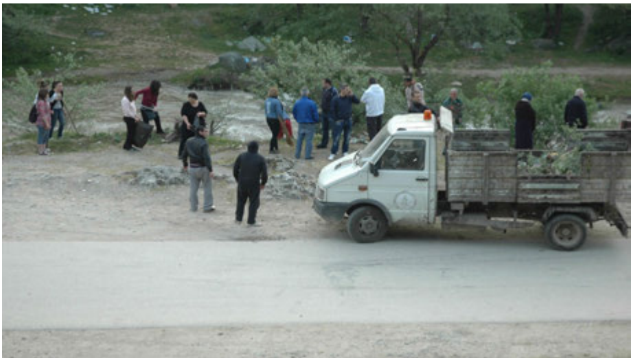
Aksioni për pastrimin e Banjës së Tetovës - 2014