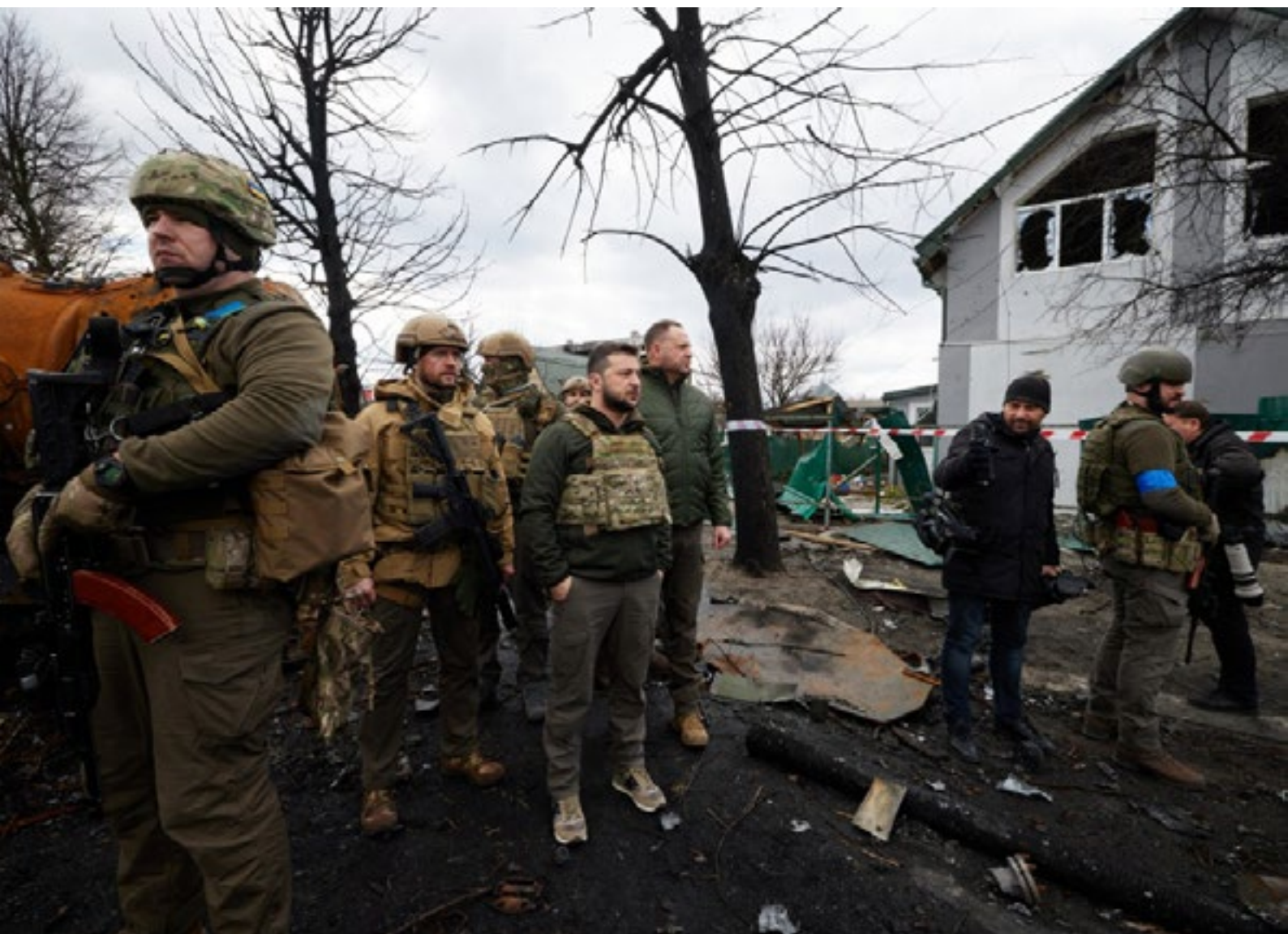
Украинскиот претседател Володимир Зеленски при посетата на бојното поле во близина на регионот на Киев.