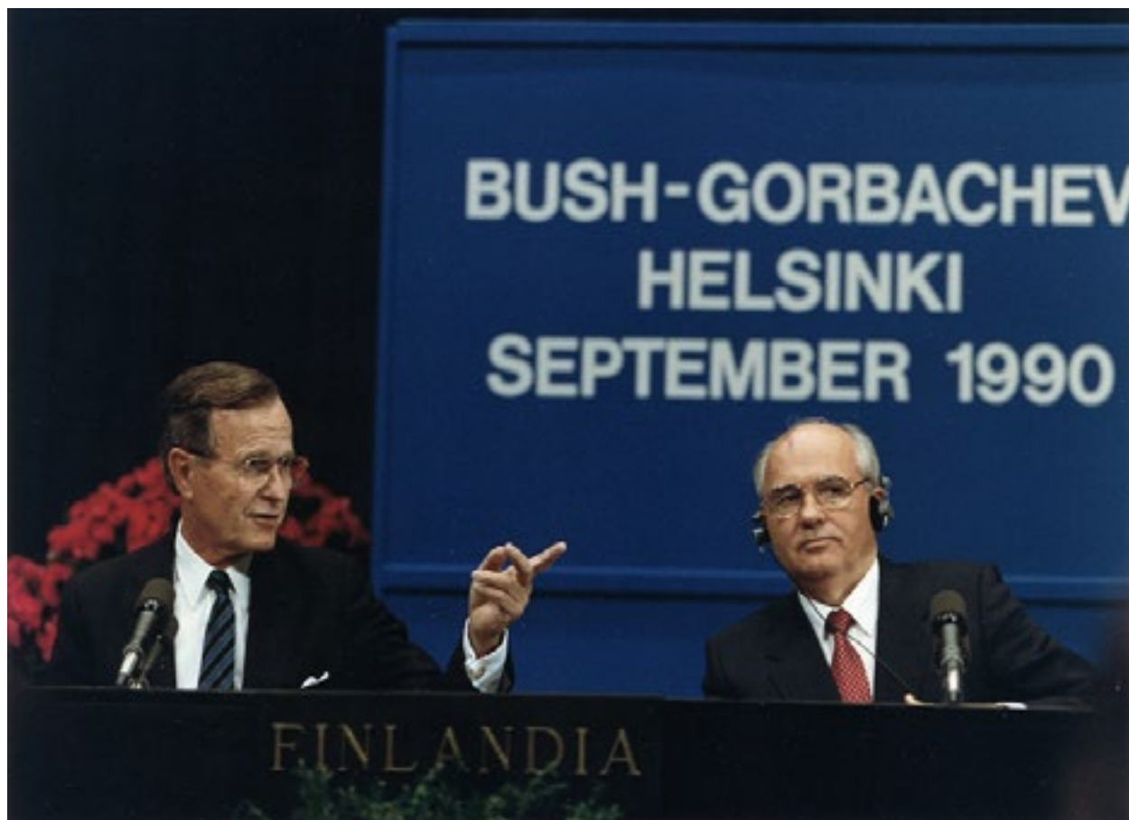
Буш-Горбачов, Хелсинки 1990.