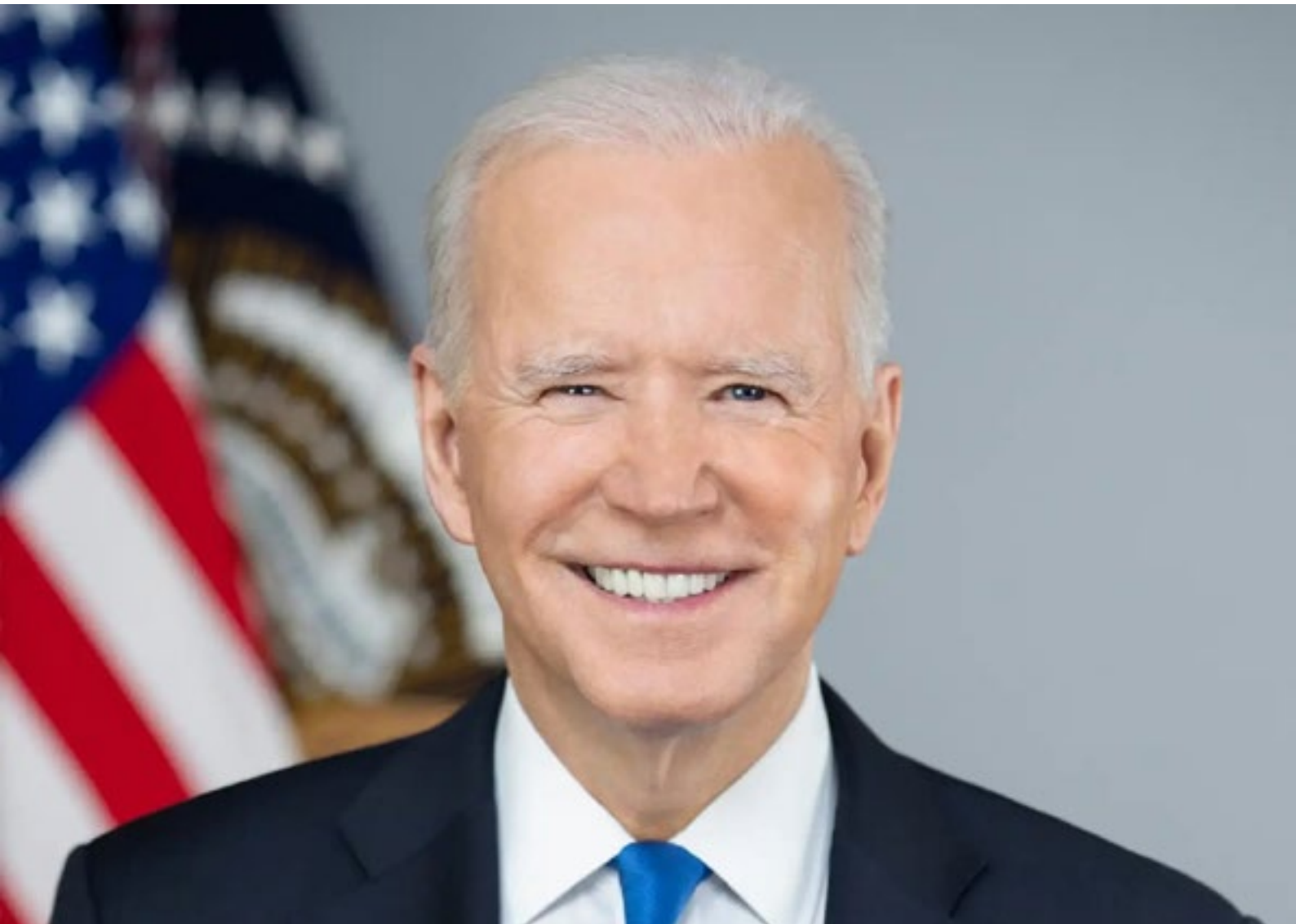
Официјален портрет на претседателот Џо Бајден