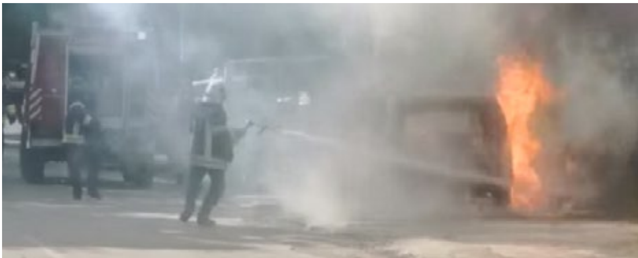
Запалени возила во Звечан.

Во истото соопштение се наведува дека НАТО решил да испрати засилен број на свои припадници во четирите општини откако албанските градоначалници влегоа во општинските згради, како превентива од насилства и да ги заштитат животите на двете страни, но дека „биле нападнати од агресивна толпа која постојано се зголемуваше. КФОР секогаш работи со цврстина и воздржаност, во рамките на строгите Правила за ангажман. Во овој случај, КФОР одговори на неиспровоцираните напади на насилна и опасна толпа, додека го извршуваше својот мандат од ОН на непристрасен начин“, се наведува во соопштението од Командата на КФОР.