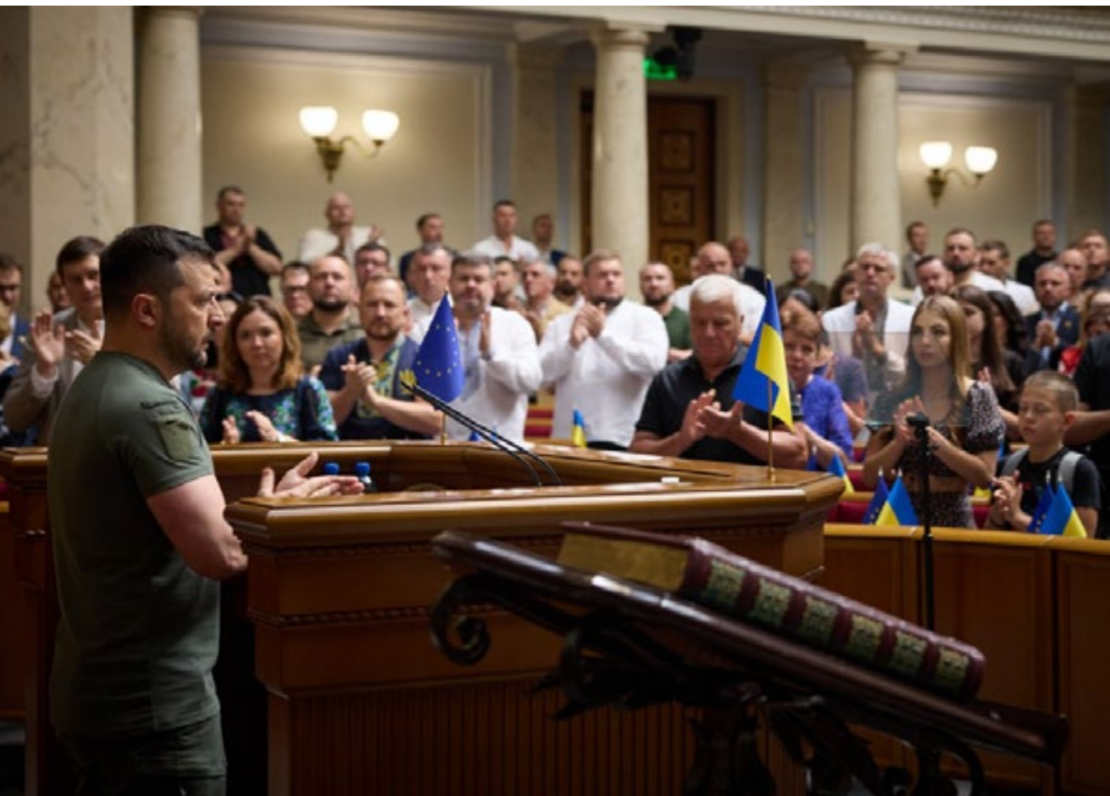
Володимир Зеленски во обраќање пред Врховната рада по повод Денот на Уставот на Украина - 28 јуни 2023 г.

Патријархот Кирил отворено ја поддржува воената инвазија на Русија врз Украина. Како што веќе пишувавме, Зеленски ја брани Украина од руска пропаганда во црквите.