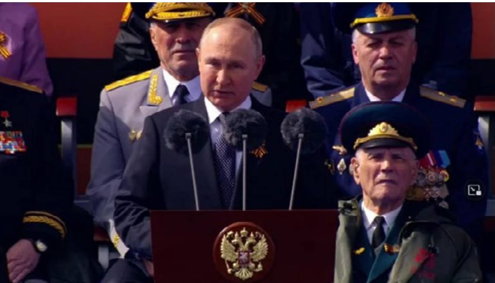
од Парадата на победата во Москва 09.05.2022 г.

Тоа што може да се извади како константа за целата ова „меѓукултурна војна“ базирана на дезинформации, лажни вести и теории на заговор, е што Русија често се вмешува на страната на традиционалистите и поддржува радикални десничари во западните земји. Телевизиите финансирани од руската држава како „РТ“ и „Спутник“ долго време зрачеа во либералните западни држави, а пропагандата пласирана од нив, која беше со цел да се подрие довербата во западните системи, неретко се споделуваше од страна на десничарските групи. Франција неодамна разоткри обемна руска кампања чија што цел беше да се подрие поддршката од Западот за Украина, извести француската државна агенција Vigipum, чија намена е борба против странски дигитални вмешувања. Војната во Украина значително ги засили ваквите дезинформации и лажни вести кои се шират на Западот и особено на Балканот, а произлегуваат од „руските кујни“.