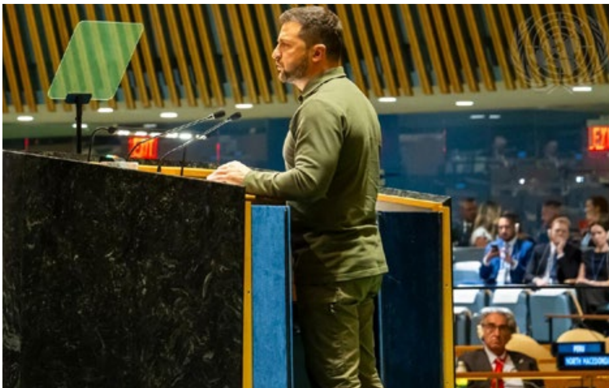
Претседателот на Украина при своето обраќање на 78. Сесија на Генералното собрание на Обединетите нации, 19 септември 2023 г.

Имено, еден од украинските медиуми чие лого е искористено и во видеото од постот кој го рецензираме објави демант со наслов „Соопштение од Едини новини, за маратонот во врска со лажната информација дека имало измени во преносот во живо од говорот на претседателот на Украина во ОН“.