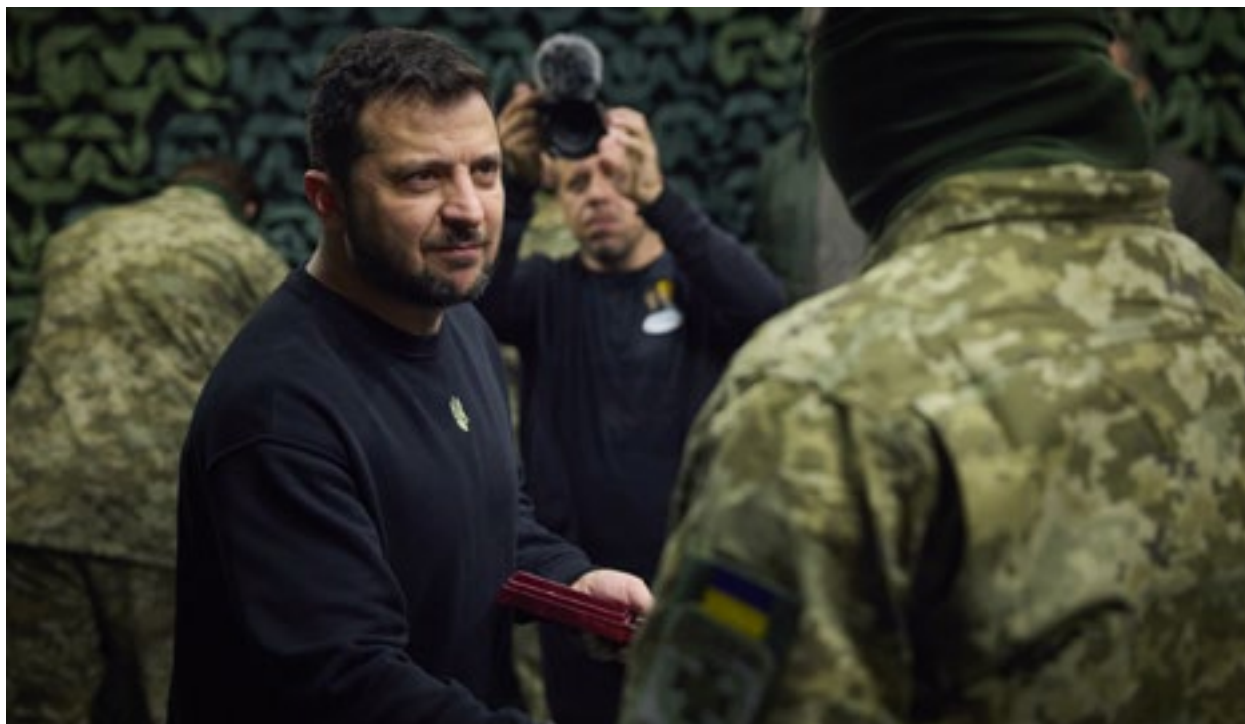
Володимир Зеленски при посетата на регионите Керсон и Миколаев, 20 октомври 2023 г.

Институтот за масовни комуникации објави дека пропагандисти лажно тврдат дека видеото од говорот на Зеленски било изменето во преносот во живо во украинските медиуми. Поради сите горенаведени факти постот кој го рецензираме го оценуваме како неистинит.