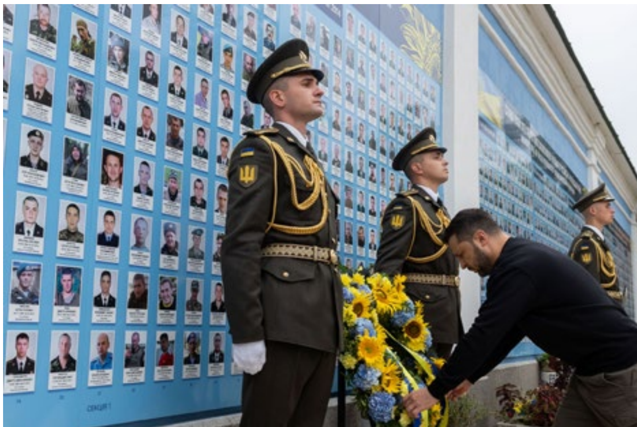
Зеленски положува свежо цвеќе пред спомен обележјето на загинатите борци во војната со Русија при одбележувањето на Денот на бранителите на Украина, 01 октомври 2023 г.

Украинскиот претседател е врзивното ткиво кое ги обединува сите напори на земјата за одбрана против руската агресија и тоа на сите фронтови. Зеленски е најзаслужен за високиот морал на украинските оружени сили, за дипломатската, воената и финансиската поддршка која Украина ја ужива и добива од целиот демократски свет и за поддршката која неговата политика ја добива од граѓаните на Украина. Напорите на земјата за одбрана од агресијата ќе изгледаа сосема поинаку ако на челото на земјата не беше лидер каков што е Зеленски. Токму затоа Кремљ ќе продолжи да прави сè што е во негова моќ да го наруши, па и да го уништи неговиот кредибилитет, а со тоа и да ја намали и минимизира меѓународната поддршка за Украина. И тоа особено ако состојбата на фронтот продолжи да не се развива во корист на Кремљ.