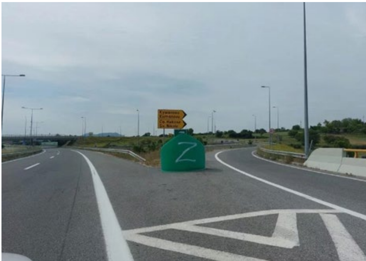
Симболот на руската окупација врз Украина испишан на знаци на автопатот Миладиновци-Штип;

Мета.мк пред неколку дена го забележа вандалскиот чин, кој покрај тоа што шири туѓа пропаганда во земјава на многу евтин начин, претставува вистинска опасност за безбедноста во сообраќајот, бидејќи сообраќајните знаци треба да служат за информирање на возачите кои управуваат со своите возила.