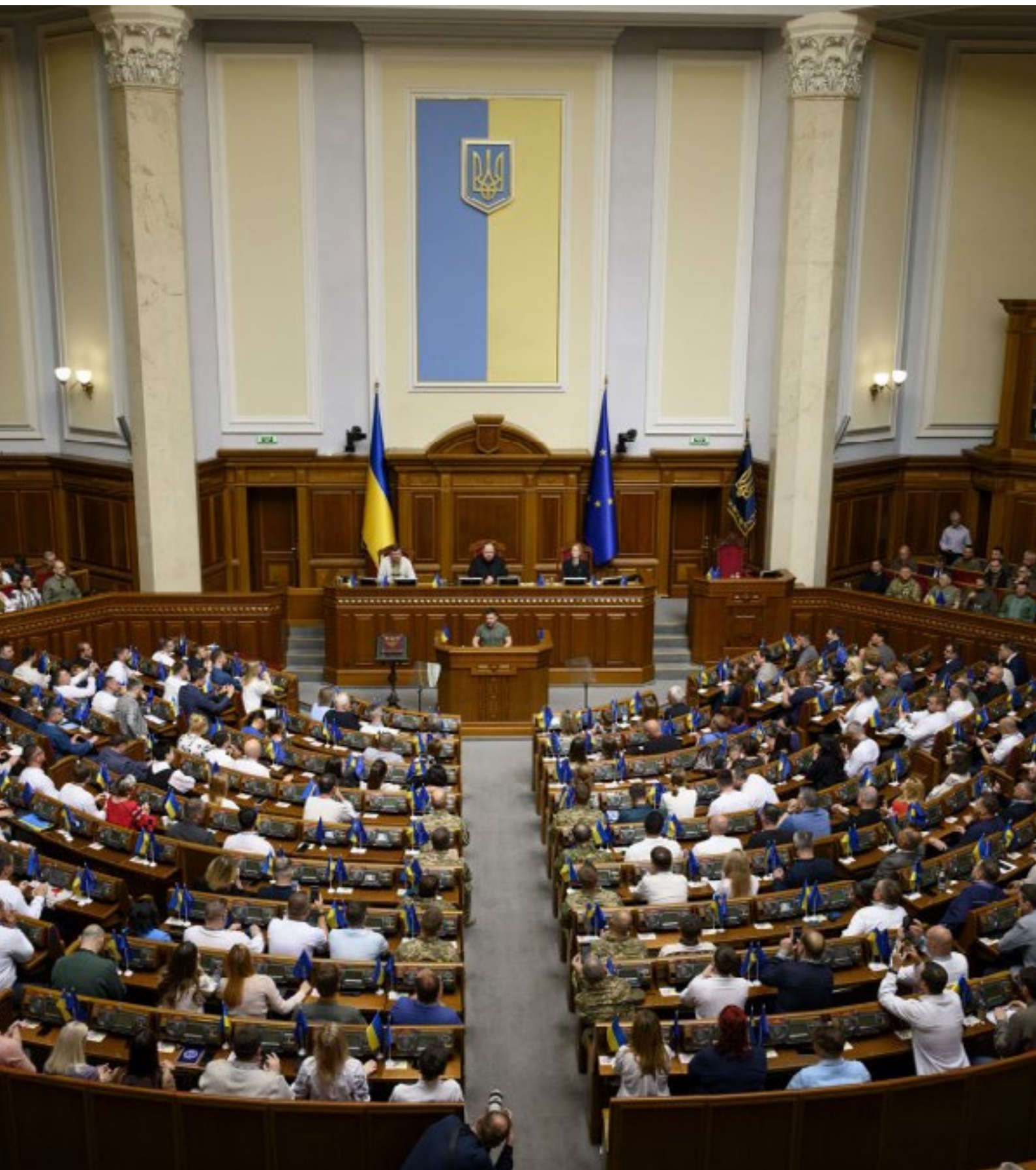
Володимир Зеленски во обраќање пред Врховната рада по повод Денот на Уставот на Украина - 28 јуни 2023 г.