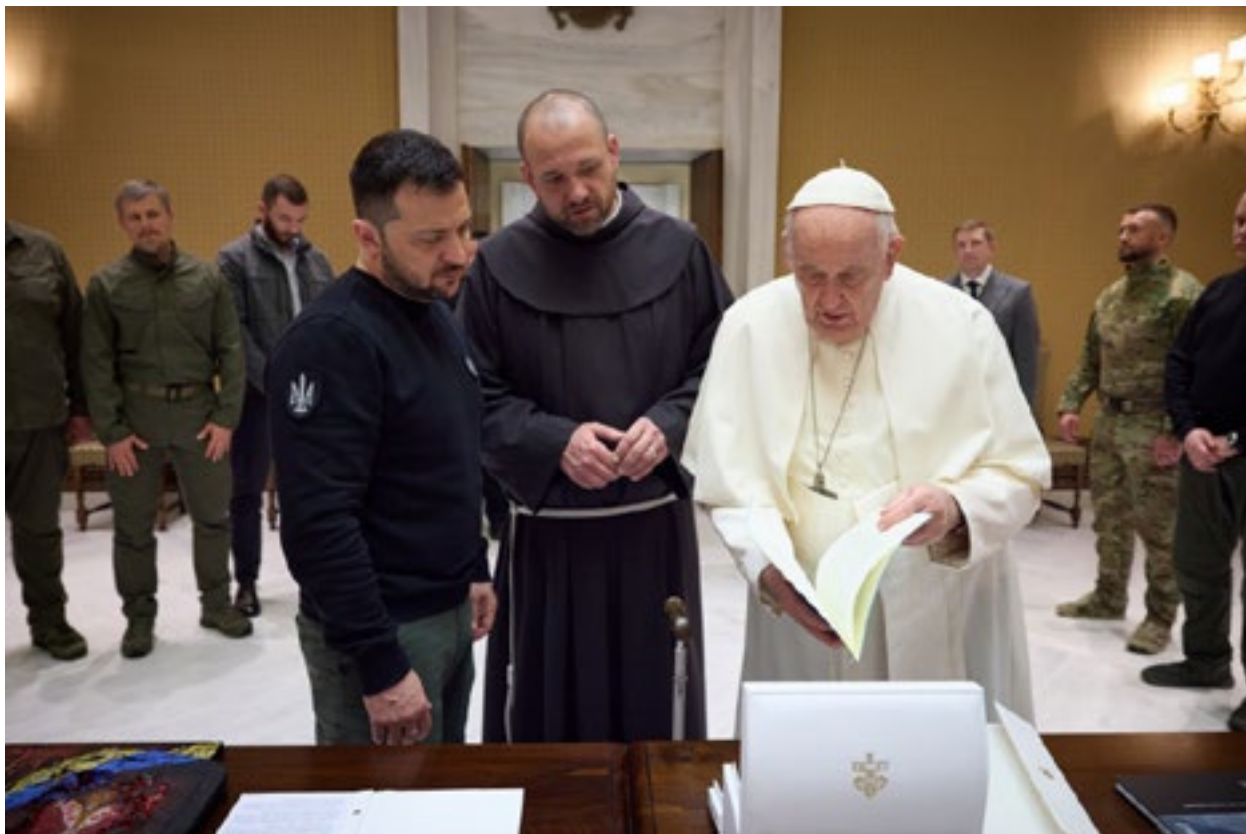
Володимир Зеленски при посетата на Ватикан и Италија се сретна со Папата Франциск, 13 мај 2023 г.