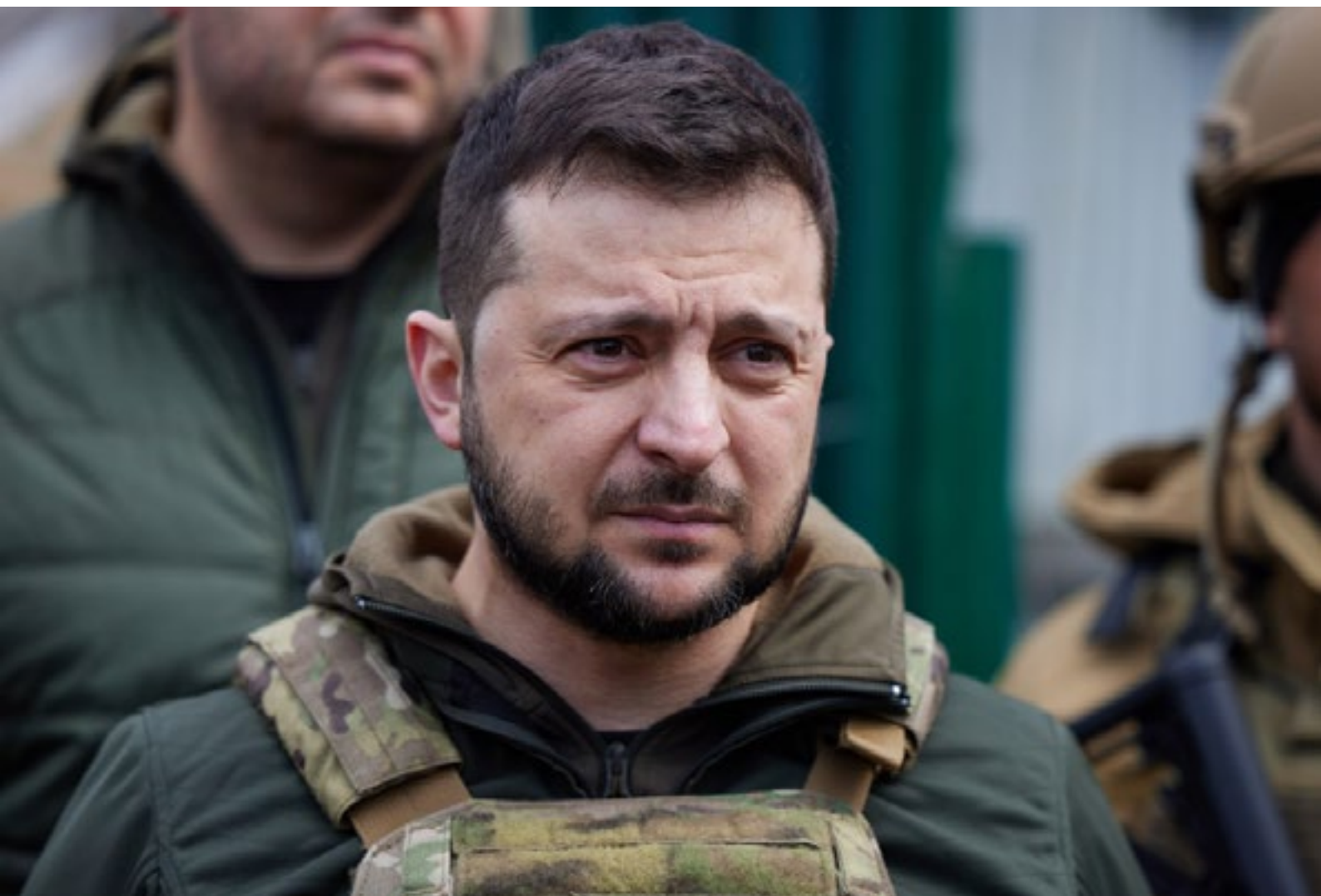
Украинскиот претседател Володимир Зеленски при посетата на бојното поле во близина на регионот на Киев.

Поради сите горенаведени факти, постот кој го рецензираме го оценуваме како невистинит . Западните елити не се спремаат да уживаат во ескалација на долго подготвуваната војна. Тие немаат подготвено војна, ниту, пак, уживаат во нејзината ескалација, бидејќи таа значи загубени животи, уништени градови, но и геостратешки воопшто, ескалација не е поволна за никого, бидејќи тоа може да доведе до прелевање на војната и во Европа. Наративот дека во војната се борат брат против брат, односно славјански племиња кои се разединети и контролирани, односно насочени од страна на Западот едни кон други, е неприменлив во состојба кога една држава влегува на територијата на друга суверена и демократска држава и почнува да ја бомбардира.