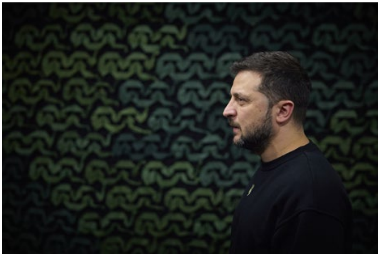
Зеленски најважната дезинформациска мета на Кремљ] Володимир Зеленски при посетата на регионите Керсон и Николаев, 20 октомври 2023 г.

Уште на почетокот на руската инвазија врз Украина, властите во Кремљ сметаа дека таа ќе биде готова за три дена и дека Киев ќе падне ако не првиот, тогаш сигурно вториот ден. При таков план „елитните“ трупи на чеченскиот лидер, Рамзан Кадиров , инаку дел од руската национална гарда, заедно со другите руски трупи влегоа во Украина од север, преку Белорусија, во надеж преку „блицкриг“ да го заземат украинскиот главен град. Но, чеченските трупи, покрај заземањето на Киев, имаа и друга задача доделена од нивните шефови во Кремљ – да го најдат и да го убијат украинскиот претседател Володимир Зеленски . Таквиот план, како што е многу добро познато, не успеа. Не само што Зеленски не беше убиен, туку ни Киев не беше заземен. И уште повеќе, на почетокот на март 2022 година, украинските воени власти известија дека „елитната“ чеченска единица, која имаше задача да го убие Зеленски, е всушност, самата уништена од страна на оружените сили на Украина, како што беа уништени и редица други елитни и искусни руски воени единици при неуспешниот напад врз Киев ланската зима и пролет.